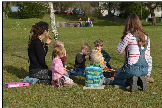
Zvieri im Park des Pflegeheims Rehalp

setzen. Dadurch entsteht eine bessere Betreuungs-Relation 4 , was wiederum die pädagogische Qualität erhöht und dazu beiträgt, sich vorteilhaft von der Konkurrenz abzuheben. Abgesehen davon verlangte die Krippenaufsicht angesichts des speziellen Konzepts eine etwas bessere Betreuungs-Relation.