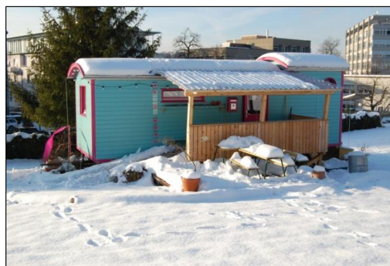
KITA-MOBIL im ersten Winter

Idee und Konzept konnten sich bereits im ersten Betriebsjahr voll und ganz bewähren. Der Winter 2012 / 2013 war ausgesprochen lang und kalt. Der Alltag im KITA-MOBIL erfuhr dadurch jedoch keine Einbussen. Im Gegenteil, die vielen gemütlichen Stunden im warmen Zirkuswagen haften in schöner Erinnerung. Nun zeigte sich, dass die hohen baulichen Auflagen zur Wärmedämmung durchaus ihren Sinn hatten. Zur gleichen Erkenntnis führte der überdurchschnittlich heisse Sommer im Jahr 2013. Auch angesichts jener Hitzeperioden wurde klar, dass der Zirkuswagen durch seine gute Isolation die Aussentemperaturen problemlos regulierte.