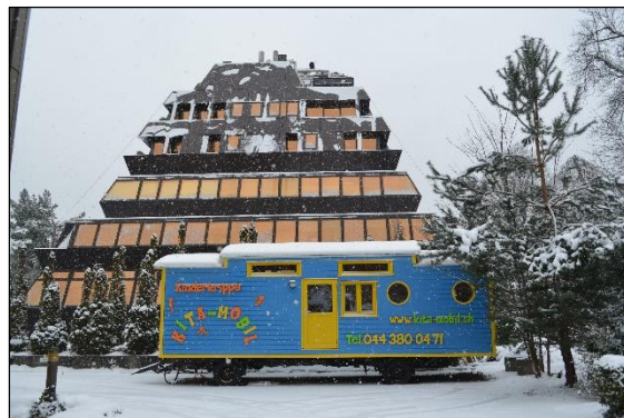
KITA-MOBIL Nummer 2 vor der Pyramide in Zürich

Der Bau eines Wagens nahm etwas mehr als ein halbes Jahr in Anspruch. Der erste Wagen wurde im April 2012 und der zweite Wagen im November 2012 fertiggestellt. Die räumlichen Aussenmasse der Wagen sind von der Grösse der Fahrgestelle abhängig und betragen ca. 10 m (L) x 2.5 m (B) x 3.2 m (H). In den Schlafbereichen beträgt die Höhe ca. 3.6 m. Die Nutzungsfläche umfasst ca. 20 - 25 m 2 .