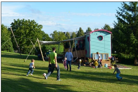
Väter und Kinder beim Fussballspiel

Die E+S GmbH verstand KITA-MOBIL als pädagogisches und soziales Projekt mit viel gesellschaftlichem Mehrwert. Die pädagogische Arbeit orientierte sich an einem modernen Verständnis frühkindlicher Bildung. Das Bildungskonzept von KITA-MOBIL enthielt dabei Impulse aus der Reform-, Natur-, Wald- und Inklusionspädagogik. Zudem stützte es sich auf den Orientierungsrahmen (siehe Anhang) zur frühkindlichen Bildung in der Schweiz.