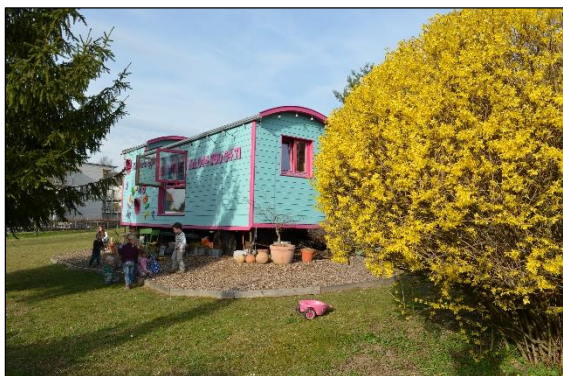
Kinder beim Spielen vor dem KITA-MOBIL

Wie sich im Rückblick zeigt, erwies sich dieser Kooperationspartner als ein wahrer Glücksfall. Rasch entwickelte sich eine rundum glückliche und wertvolle Zusammenarbeit. Allerdings verdeutlichte das Pilotprojekt, dass der Standort mit der Region Zürichberg falsch gewählt war. Denn die Nachfrage entpuppte sich als eines der Hauptprobleme des Pilotprojekts.