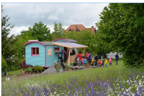
Spielnachmittag im Frühling

Ebenfalls mit dem Verständnis als social entrepreneur nahm die E+S GmbH dann zweimal an einem Business-Wettbewerb von SEIF 11 teil (Wettbewerb 2013 und Wettbewerb 2014). SEIF steht für «social entrepreneurship impact & finance» und unterstützt Personen oder Teams, die mit innovativen Ideen unternehmerische Antworten für wichtige Fragestellungen unserer Gesellschaft suchen. Im Jahr 2014 wurde das Projekt «KITA-MOBIL» für das «IMPACT BOOST PROGRAM» ausgewählt, einem Mentoring-Programm, das SEIF zu jenem Zeitpunkt mit der UBS zusammen realisierte. Im Rahmen dieses Programms wurde die E+S GmbH über mehrere Monate von einem Projektspezialisten der UBS mit Rat und Tat unterstützt.