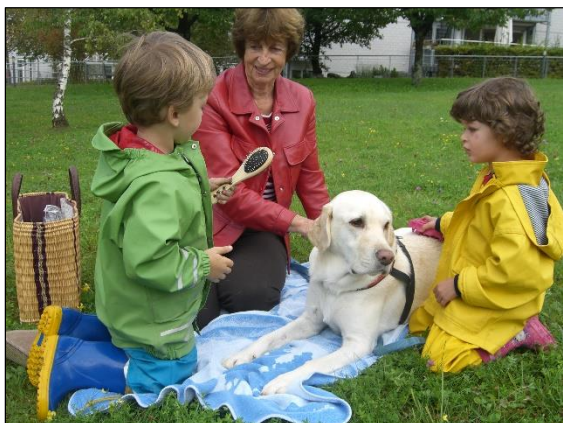
Besuch von Quina, dem Therapiehund

Therapiehund mit dem Namen Quina das KITA-MOBIL.