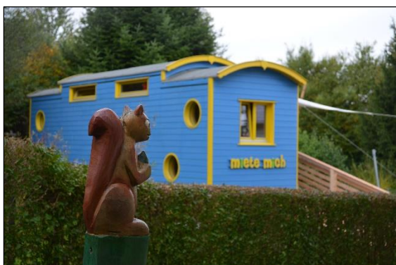
Das zweite KITA-MOBIL beim Tierspital

Bei allen diesen Empfehlungen steht die Eröffnung eines neuen Standorts im Fokus. Demgegenüber eignet sich das KITA-MOBIL aber ebenso für die Erweiterung eines bereits bestehenden Angebots. Beispielsweise würde es einer Kinderkrippe, die an räumliche Grenzen stösst, erlauben, eine zusätzliche Gruppe aufzubauen. Oder eine Schulgemeinde könnte mit einem Zirkuswagen das Mittagstisch- und Kinderhortangebot ausbauen. Und wie die Vermietung des zweiten KITA-MOBILS zeigt, lässt sich mit ihm sogar problemlos ein Provisorium realisieren. Wie auch immer: Zum Zeitpunkt der Erstellung dieses Evaluationsberichts ist der Verwendungszweck des zweiten Zirkuswagens der E+S GmbH noch nicht festgelegt. Man darf deshalb gespannt auf seine Zukunft sein. Als Bijou wird er ohne Zweifel genauso viel Freude bereiten wie der erste Zirkuswagen!