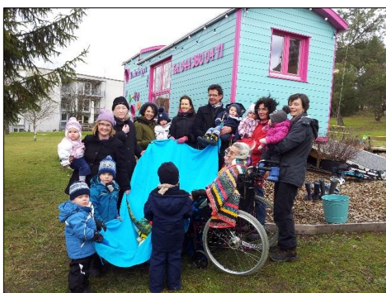
Prix Génération: Fotoshooting mit Jung und Alt

Zu Beginn des Jahres 2013 bewarb sich die E+S GmbH um den Prix Génération, der von der AXA Winterthur und dem HUB Zürich ausgeschrieben wurde. Der Prix Génération förderte den Dialog unter den Generationen. Das Projekt «KITA-MOBIL» zählte zu den Finalisten des Wettbewerbs und wurde von der SCHWEIZER FAMILIE – dem Medienpartner des Prix Génération – portraitiert.