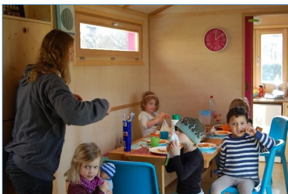
Mittagessen im KITA-MOBIL

Wenn immer möglich fand das Essen im Freien vor dem Zirkuswagen statt. Ab und zu wurde auch die Feuerstelle direkt hinter dem Zirkuswagen genutzt oder gar ein Tag mit Grillieren im Wald verbracht. Ansonsten fand das Mittagessen im Zirkuswagen statt. Der grosse Tisch bot für 10 Menschen – acht Kinder und zwei bis drei Betreuungspersonen – Platz. Drei weitere etwas ältere Kinder wurden um einen kleinen Klapp Tisch gesetzt, so dass sie unter sich waren. Auf diese Weise ergaben sich sehr gemütliche und stimmige Mahlzeiten. Auch die Znüni- und Zvieri-Situationen wurden ähnlich gestaltet. Eine grosse Hilfe war, dass das schmutzige Geschirr ins Pflegeheim zurückgebracht werden durfte, wo der Abwasch durch das Küchenpersonal erfolgte.