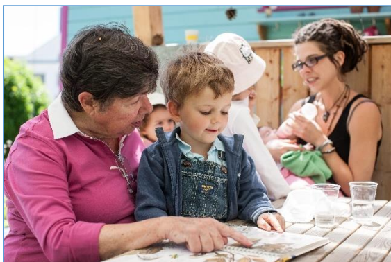
Jung und Alt begegnen sich

Da eine wichtige Prämisse des Konzepts – nämlich mit dem Zirkuswagen dorthin zu gehen, wo es eine grosse Nachfrage gab – nicht erfüllt war, beschloss die E+S GmbH, das Pilotprojekt auf Sommer 2015 zu beenden. Im Zuge von Gesprächen mit verschiedenen Trägerschaften konnte der Zirkuswagen an die benachbarte Kinderkrippe Hoppel übergeben werden. Parallel dazu konnte die bis Sommer 2015 befristete Baubewilligung um weitere zehn Jahre verlängert werden. Die Kinderkrippe Hoppel führt das Angebot mit dem Pflegeheim Rehalp zusammen weiter.