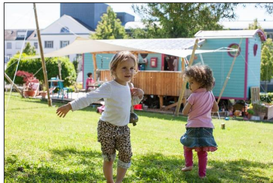
Die Kinder und «ihn» Wagen

den Alltag zu geben. Eine Haltung der jederzeit offenen Tür unterstützte die Interessierten dabei, das KITA-MOBIL besser kennen zu lernen. Zudem boten in den ersten zwei Jahren die offenen Spielnachmittage Einblick in die pädagogische Arbeit im KITA-MOBIL.