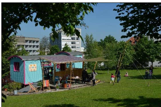
Alltag im KITA-MOBIL: Wie in den Ferien...

Zudem fand eine Befragung von rund einem Dutzend Fachleuten statt, um die Realisierungschancen für ein solches Projekt einzuschätzen. Die Fachleute waren einschlägig mit Fragen der Kinderbetreuung und den regionalen Verhältnissen vertraut. Ihre Rückmeldungen fielen durchwegs positiv aus. Sie prophezeiten dem Projekt breites Interesse und Erfolg.