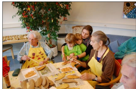
Jung und Alt beim Adventsbasteln

Die Vermittlung sozialer Werte konkretisierte sich zusammen mit dem Pflegeheim Rehalp in einer engen generationenübergreifenden Zusammenarbeit. Die Begegnungen zwischen Jung und Alt gehörten zum Herzstück des Pilotprojekts, in dessen Verlauf es zu unzähligen behutsamen und berührenden Kontakten zwischen den Kindern und den Bewohner/Innen des Pflegeheims kam.