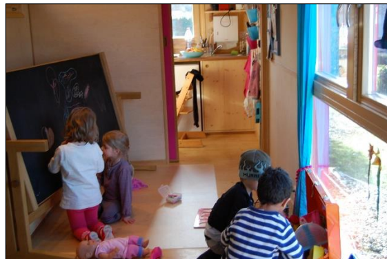
Kinder beim Spielen im Wagen

2014 stieg diese Quote auf über 100% 8 . Der Schulkreis Zürichberg war damit die am Besten versorgte Region in Zürich, was sich in Form von Neugründungen, Ausbau bestehender Krippenplätze und einer Verschärfung der Konkurrenz zeigte.