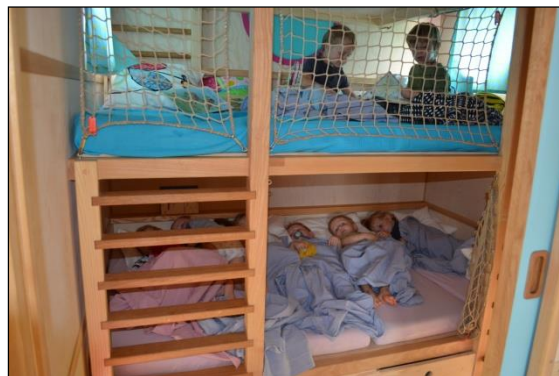
Mittagsruhe im Schlafbereich

Haltungen als hilfreich: Mehr als die Hälfte vom Alltag mit den Kindern im Freien verbringen; bei Spielsituationen im Wagen die Gruppe ab sechs Kindern aufteilen; den Morgenkreis ab sieben Kindern im Freien durchführen; für die Mittagsruhe nicht nur den Schlafraum, sondern auch den Hauptraum nutzen. Mit solchen Regelungen und der Festlegung von sinnvollen Abläufen liess sich die Betreuung und der Krippenbetrieb selbst auf engem Raum unproblematisch organisieren.