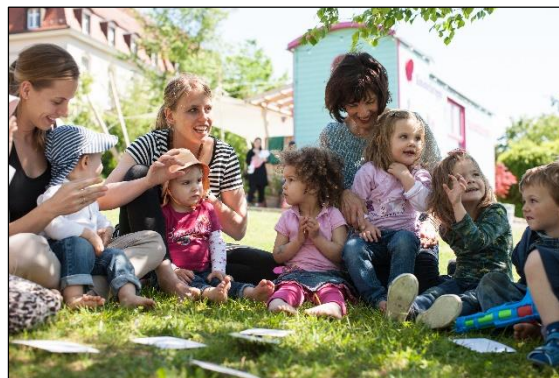
KITA-MOBIL vor dem Pflegeheim Rehalp

Standort in Zürich. Herzstück der Kooperation mit dem Pflegeheim war es, Jung und Alt zusammen zu bringen.