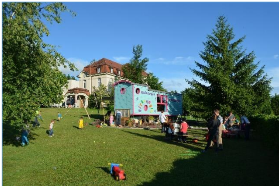
Elternabend im Sommer 2014