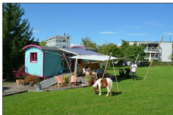
Ponybesuch am Herbstfest 2014

Die Zusammenarbeit im Team stellte verschiedene Anforderungen an das Personal. Die Organisation des Alltags bedurfte einer guten Absprache im Team und mit dem Pflegeheim. Aufgrund der eher engen räumlichen Verhältnisse war ein unkompliziertes und spontanes Naturell essentiell. Eine hohe Team- und Kommunikationsfähigkeit erleichterte die Zusammenarbeit ebenso wie ein ausgeprägtes Improvisations- und Organisationstalent. Letztere waren insbesondere wegen den verschiedenen Ansprüchen, bedingt durch das Bildungskonzept, gefragt. Zudem erwies sich die Freude an der Arbeit im Freien als unabdingbar.